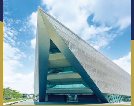
追手門学院大学・茨木総持寺キャンパス (大阪府茨木市)